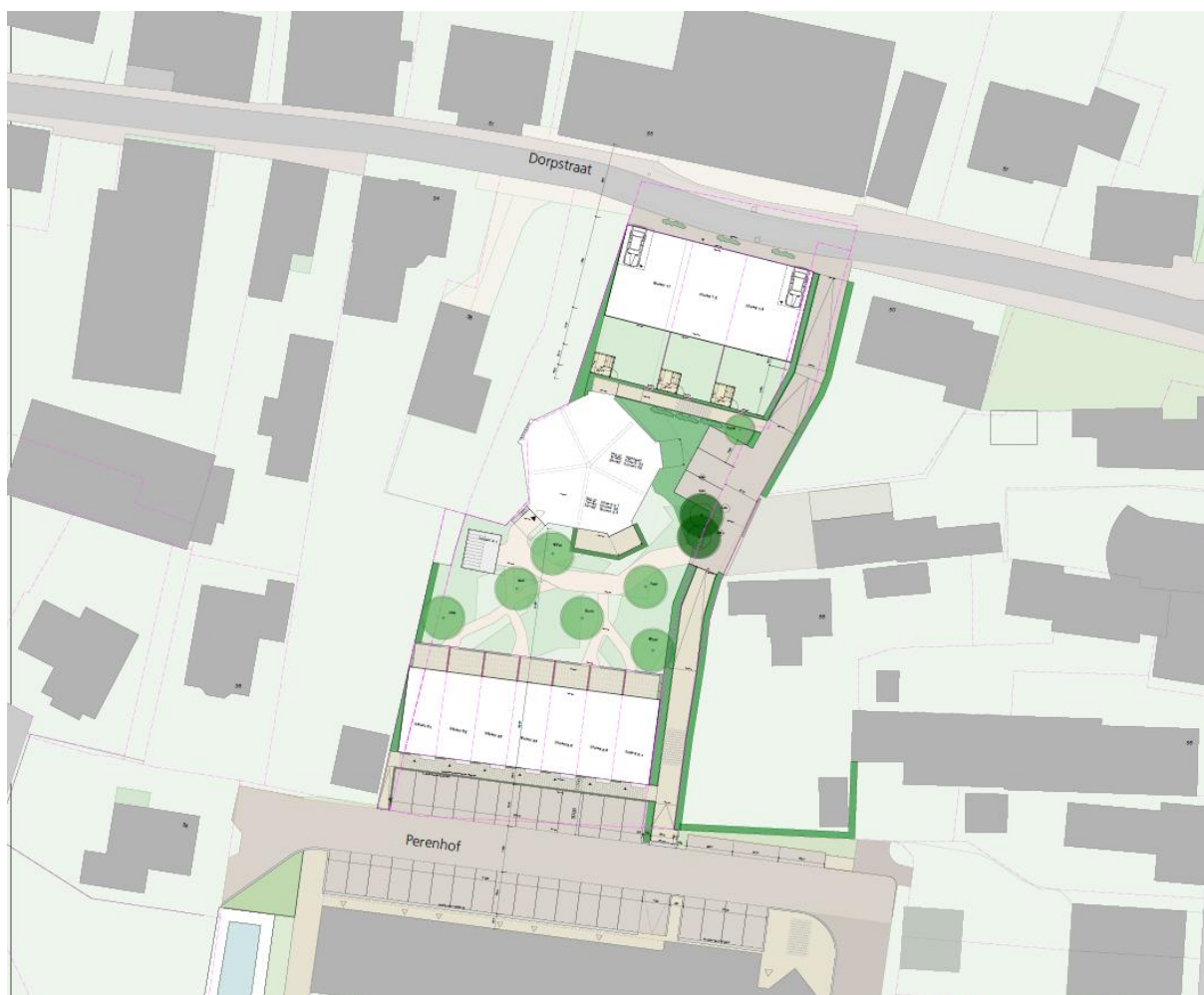
figuur 2: ontwerp toekomstige situatie Dorpsstraat 42 te Heerjansdam en ontwerp Boomgaardkerk (bron: Hersbach en Könst Architecten).