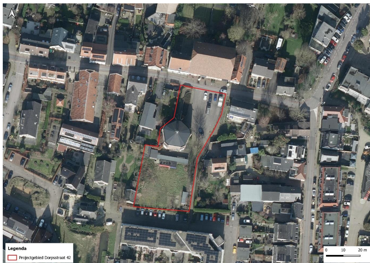
figuur 1: luchtfoto (2021) van de projectlocatie

Het projectgebied is gelegen aan Dorpsstraat 42 te Heerjansdam en bestaat uit de Boomgaardkerk met parkeerterrein en kleine bijgebouwen waarbij tuinen gelegen zijn. De omgeving van het projectgebied bestaat uit een oude dorpskern waarin vrijstaande woningen en woonwijken gelegen zijn. De omgeving rondom het projectgebied is zeer groen waarin veel bomen en struiken te vinden zijn. De projectlocatie en de invloedssfeer van de werkzaamheden is aangegeven in figuur 1.