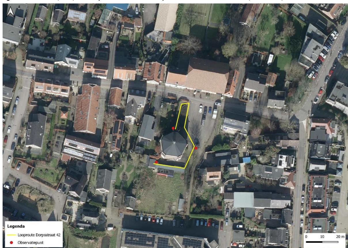
figuur 3: luchtfoto (2021) met looproutes en observatiepunten van de onderzoekers.

Het vaststellen van een winterverblijfplaats is bij de kerk niet mogelijk door de onbereikbare delen in de bouw, waardoor endoscopisch onderzoek bemoeilijkt wordt. Daarom is ervan uitgegaan dat een eventueel aangetroffen verblijfplaats ook gebruikt wordt als een regulier winterverblijf.