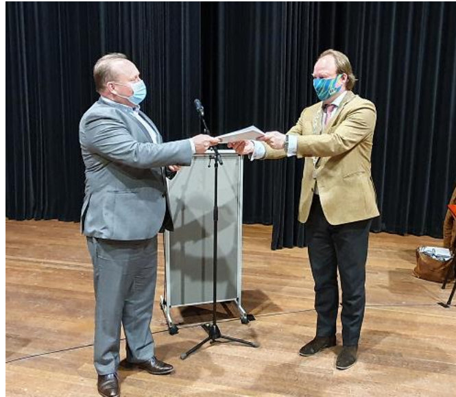
Overhandiging van het rapport de Staat van Zwijndrecht aan de gemeenteraad 1 februari 2022