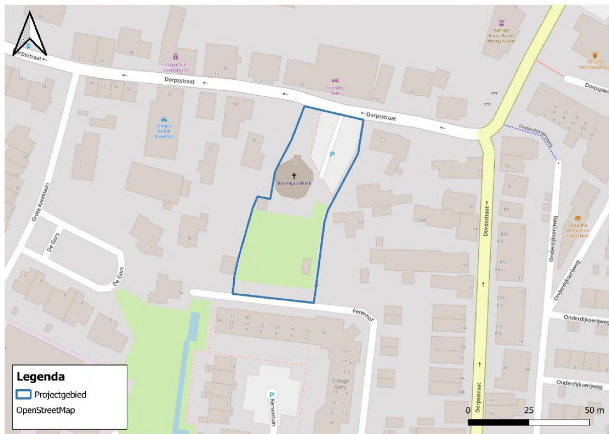
figuur 1: projectgebied, plan- en onderzoeksgebied, (Qgis, 2022).

Onderstaand is de locatie van het plangebied weergegeven.