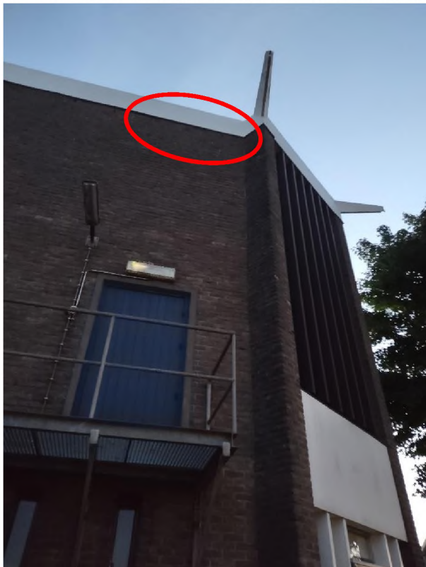
Zomerverblijfplaats gewone dwergvleermuis Gevel Dorpsstraat 42