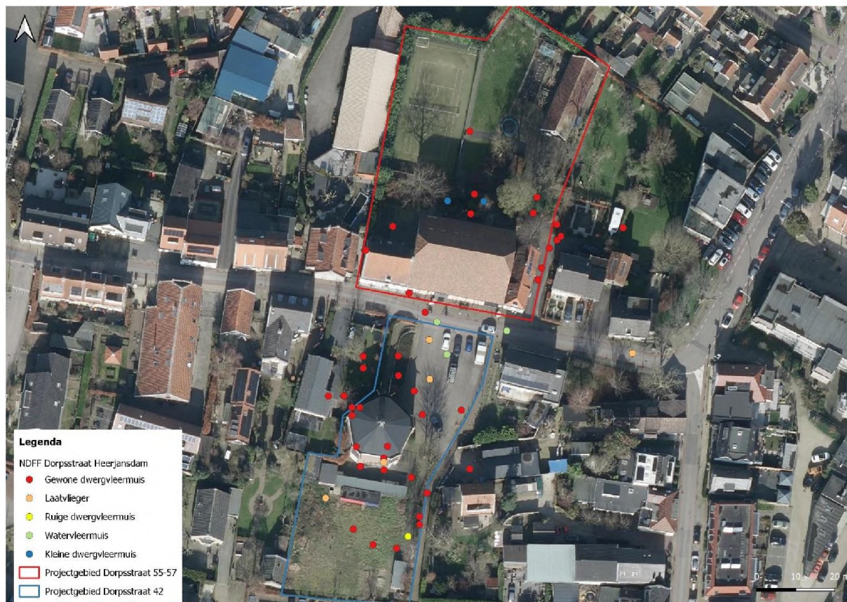
figuur 4: luchtfoto (2021) met de waarnemingen van vleermuizen.